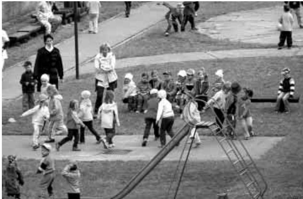
Generálka na vystoupení