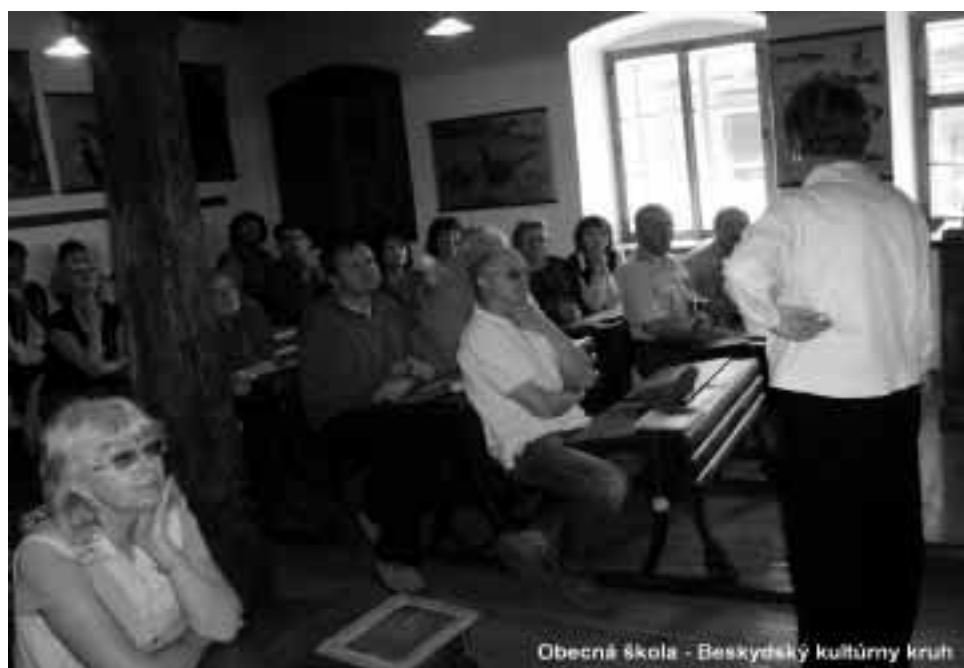
Obecná škola - Beskydský kultúrny kruh