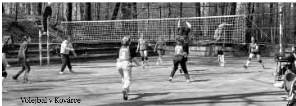
Volejbal v Kovárce