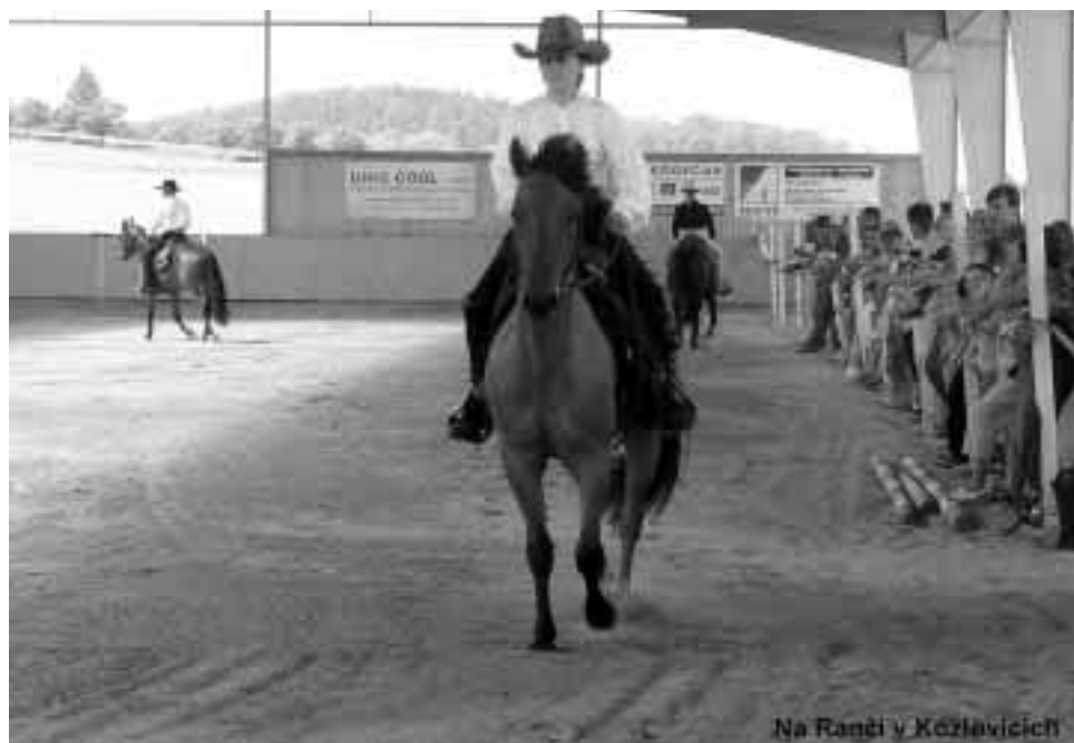
Na Ranči v Kozlovicih