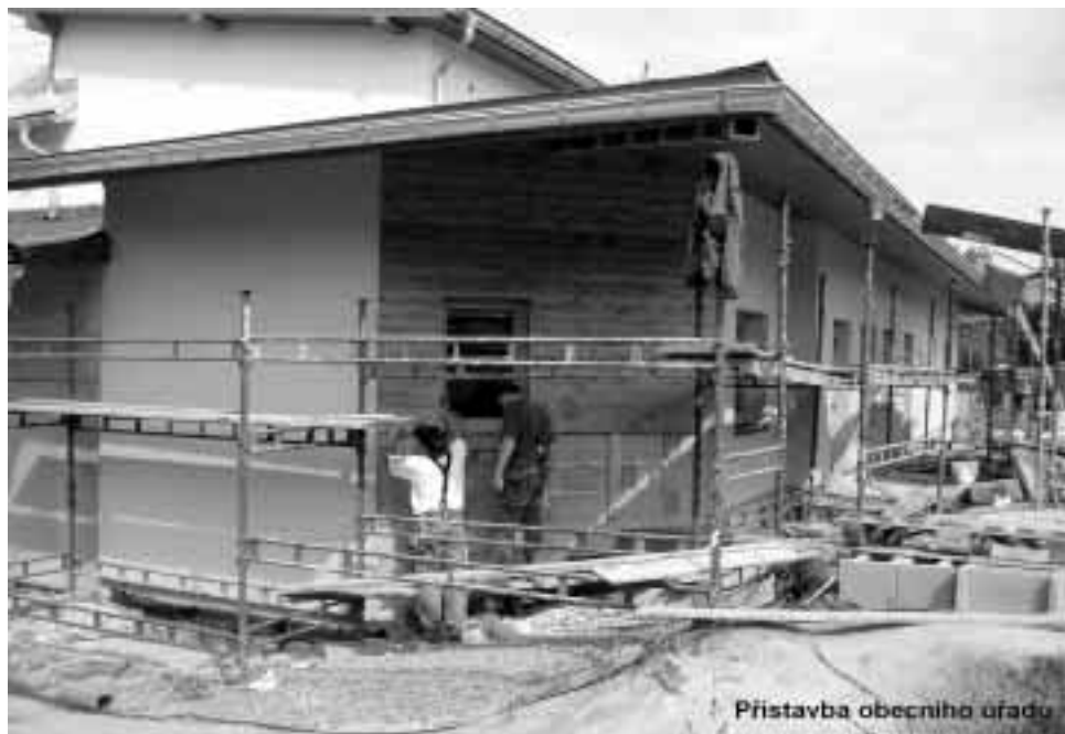
Pristavba obecniho uradu