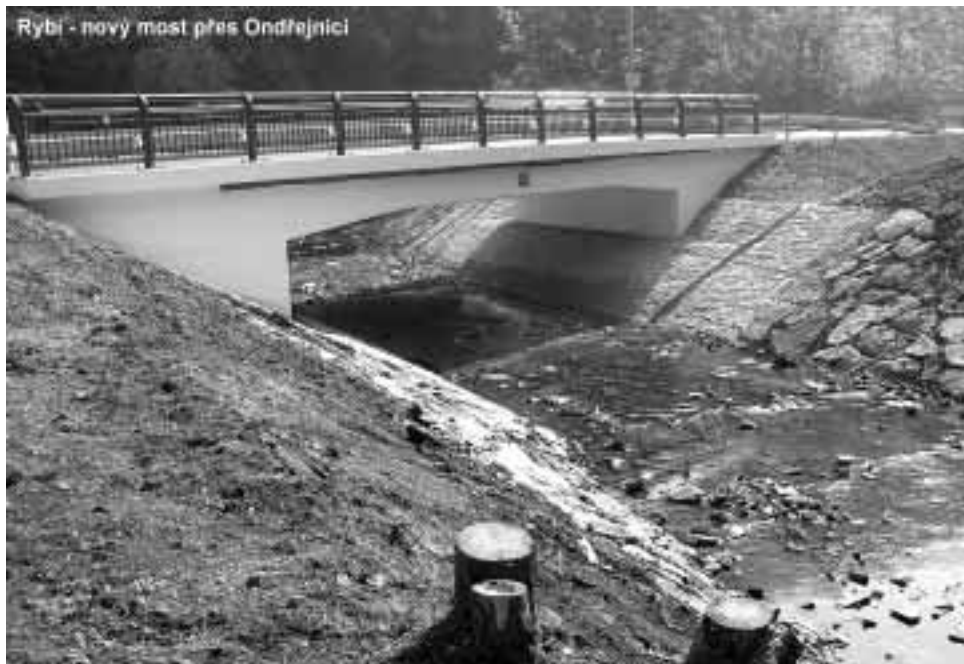
Rybi - nový most přes Ondřejnici