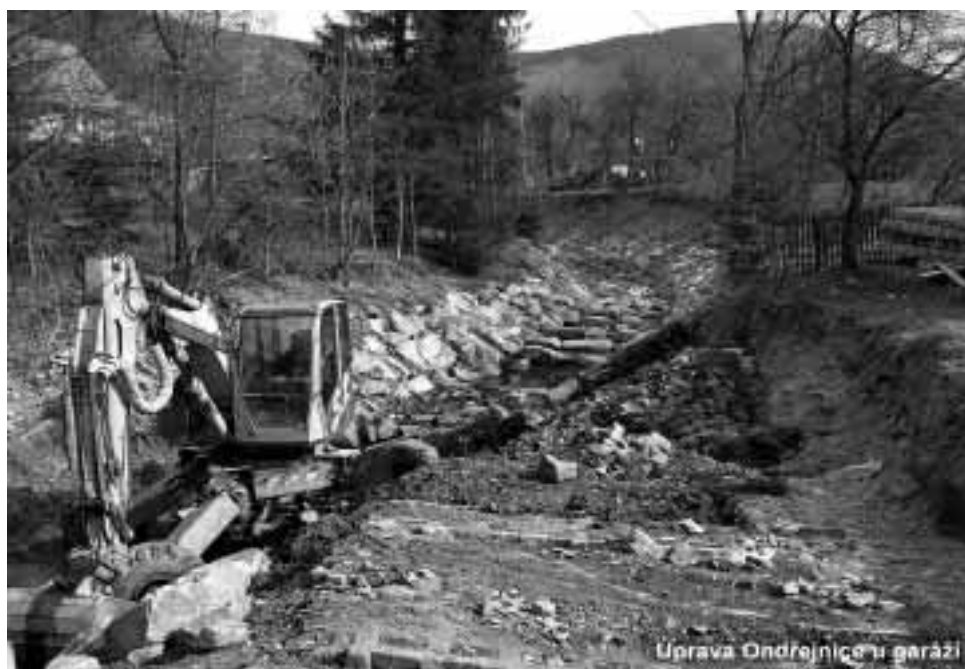
Úprava Ondřejnice u garáží