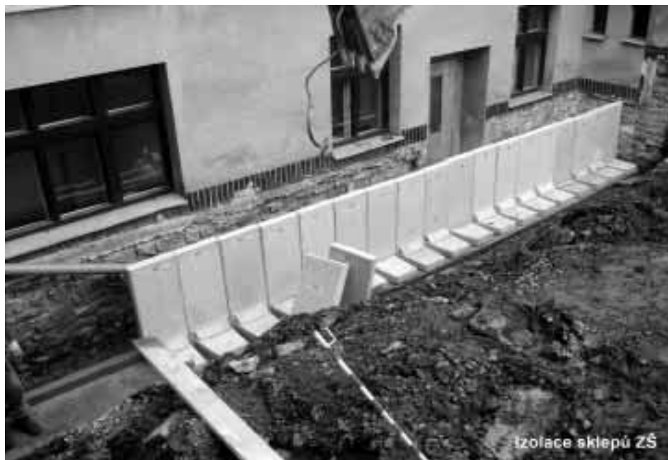
izolace sklepů ZŠ