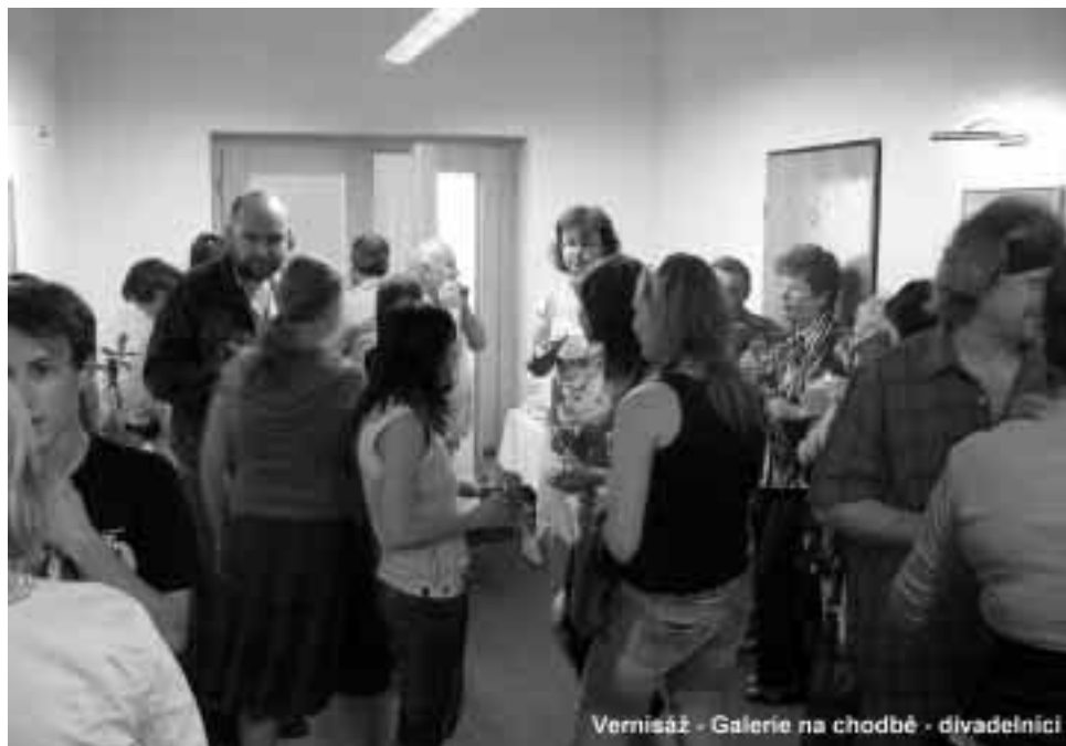
Vernisáž - Galerie na chodbě - divadelnici