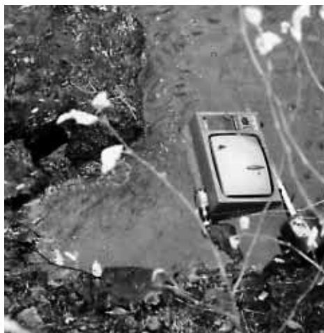
2. Televizor v Říčce (u ZD)