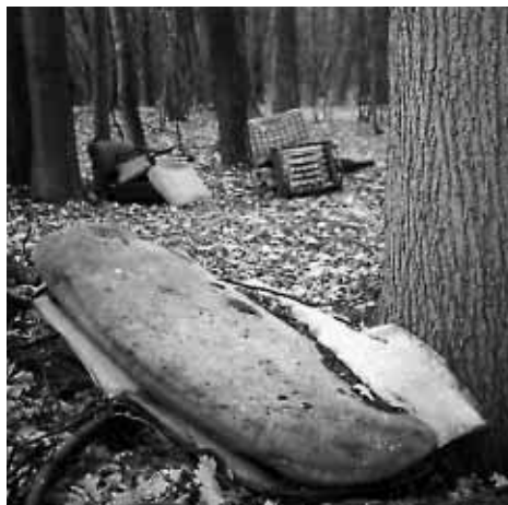
1. Autosedačky v lese (Bahená)