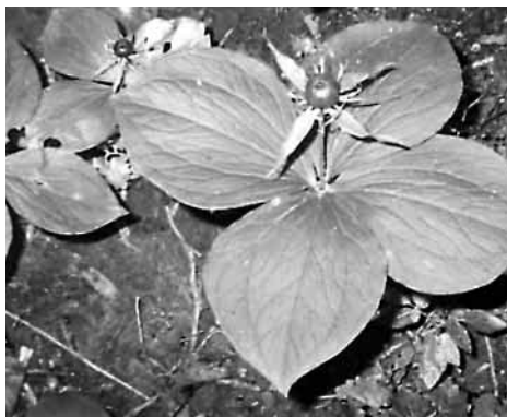
Vraní oko čtyřlísté.

ohrožené — otakárek feniklový (podle odborníků náš nejušlechtlejší motýl), všechny druhy čmeláků, rak bahenní, ropucha obecná a většina ostatních žab, skorec vodní (pták chodící pod vodou po dně potoka), čáp bílý, rorýs obecný, vlaštovka obecná, brkoslav severský (pobyt jen v zimě), křkavec velký, veverka obecná.