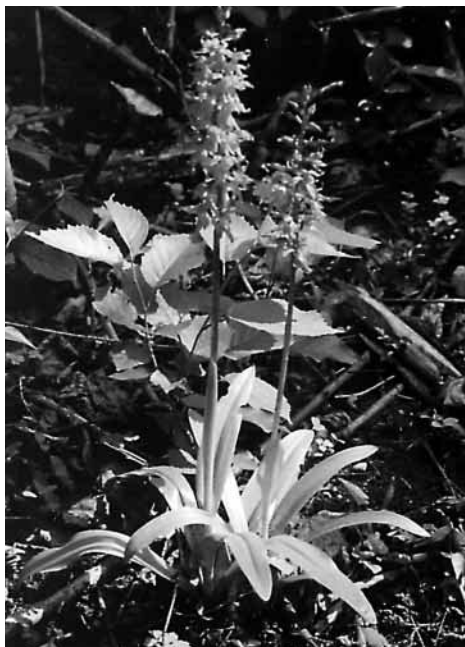
Vstavač mužský (orchidej).

Tyto vegetační pásy splňují funkci biokoridorů, filtračních ochranných pásů, manipulačních pásů a pásů krajinnětvorné doprovodné zeleně.