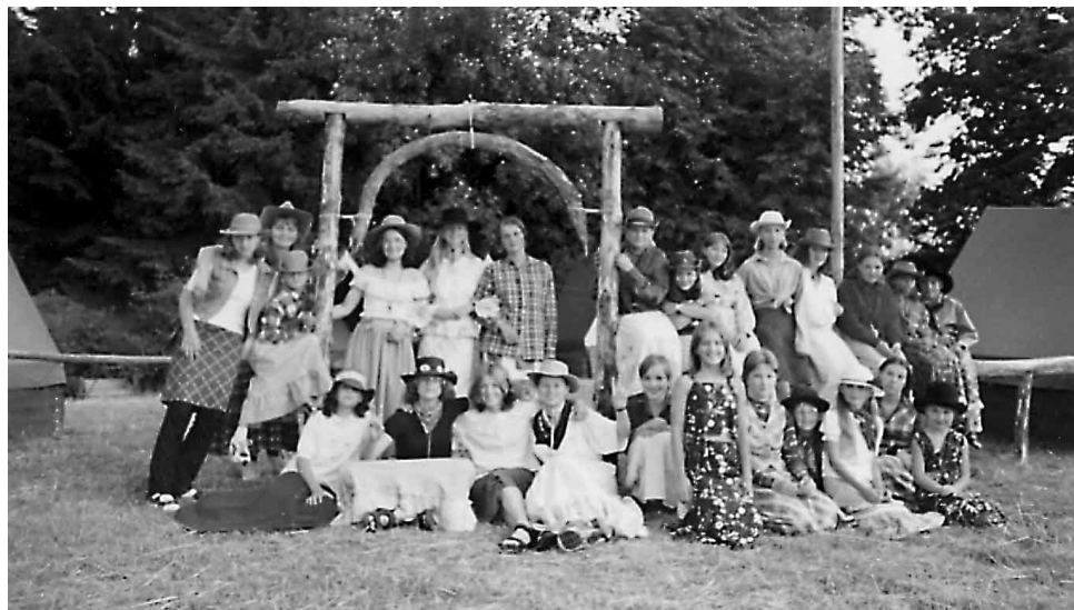
Skautky v country. Vyšší Lhoty 2002.

Skauting je — účelné využití volného času — poznání, co v tobě opravdu je — příležitost ukázat, co dovedeš — přátelství, zábava a sport — odpočinek, ale i dřina a překonávání sebe sama — ochrana přírody — společný jazyk chlapců a děvčat z mnoha zemí světa — pomoc druhým — příprava na budoucí život