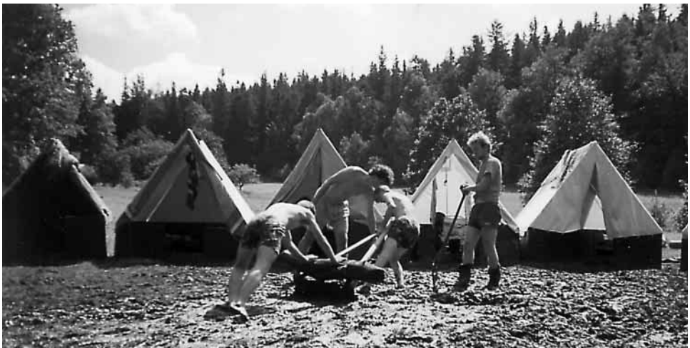
Povodňový tábor v Trojanovicích 1997

Nezapomínáme na skautské vzdělání — zúčastňujeme se různých setkání, seminářů a kurzů. Vysíláme naše oddíly a družiny na Svojsíkovy závody, na Závody světlušek a vlčat. Že neděláme Kozlovicím ostudu, dokazuje nejen jedno naše umístění na předních místech (např. na 4. v celostátním kole).