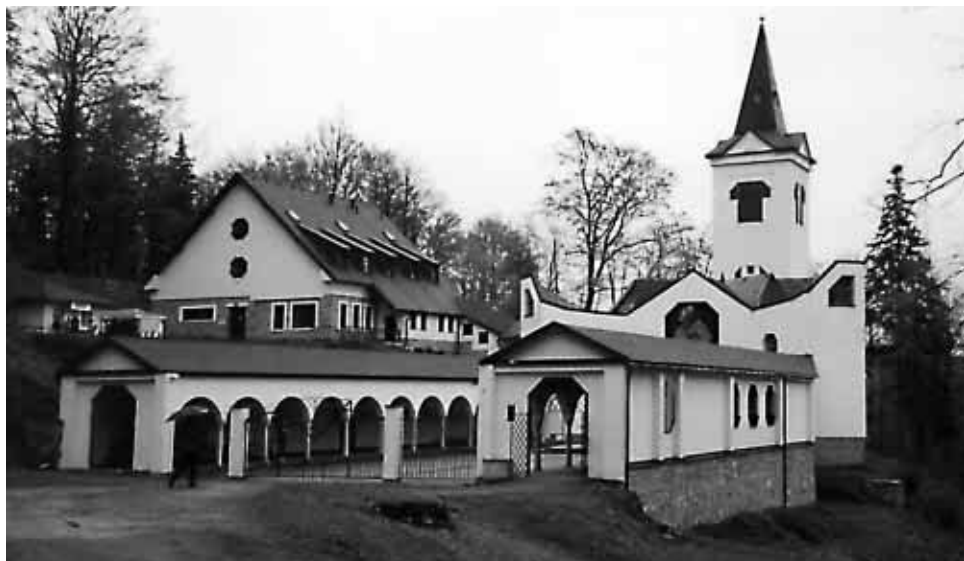
Chrám Panny Marie Zlatohorské nad Zlatými Horami

Uhlířském vrchu nad Bruntálem z roku 1758. Ten byl pro změnu po roce 1968 téměř zničen (rozstřílen) sovětskými okupanty. K dnes již obnovenému chrámu nás od Bruntálu dovede 1 km dlouhé, čtyřnásobné lipové stromořadí, založené v roce 1760.