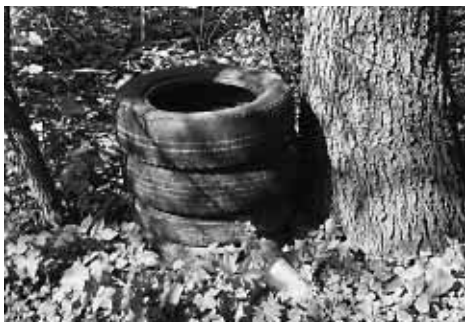
Pneuservis v lese.