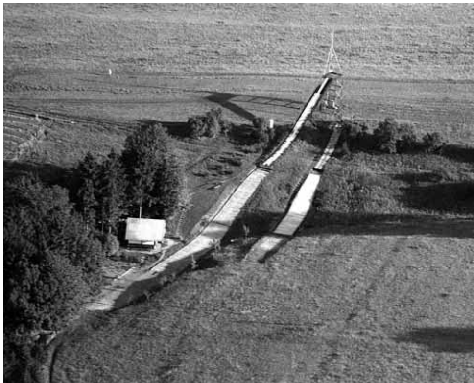
Letecký snímek obecních skokanských můstků.