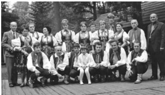
1970 - První vystoupení souboru (pod názvem Národopisná skupina Ondřejník z Kozlovic) na Rožnovských slavnostech

A tak nyní bychom chtěli alespoň poděkovat.