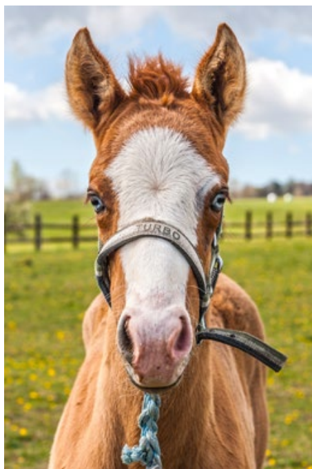
Letošní přírůstky na ranči