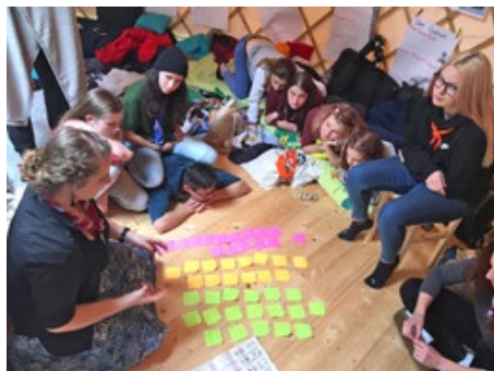
Tvorba harmonogramu tábora