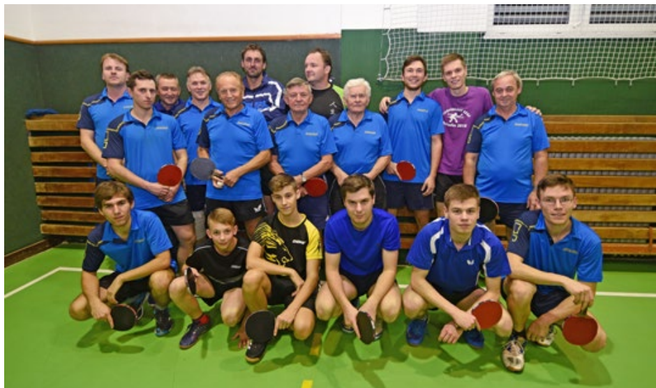
Skupinovka z tréninku, autor Petr Adámek