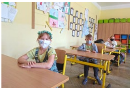
Ve škole s rouškou, archiv školy