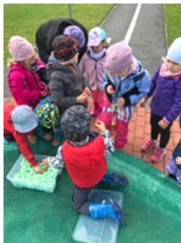
Den dětí, autor Ivana Bražinová

Jaro se letos přihlásilo mnohem dříve, než jsme čekali. Příroda se rychle probouzela a my jsme s dětmi měli naplánovaný bohatý program. Ale člověk miní, život mění. Nám naše plány změnila koronavirová pandemie, kvůli které se ke konci března mateřská škola uzavřela. Místo vynášení Mařenky, zdobení velikonočních vajíček a nacvičování besídky pro maminky děti prožívaly tyto jarní tradice a radosti