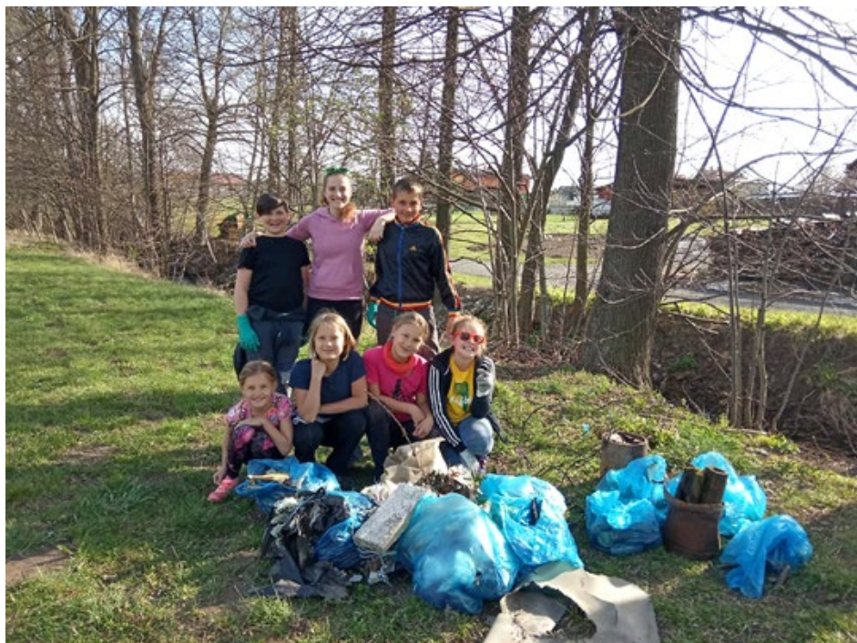
PAKOTEAM