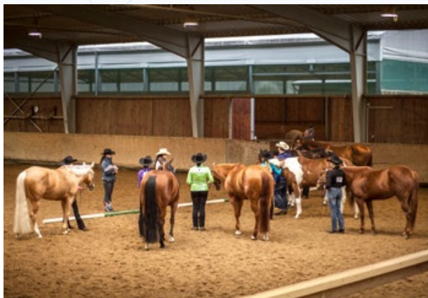
První letošní závody v hale

Výcvik jízdy na koni zde mohou pod vedením profesionálních jezdců absolvovat dospělí i děti, a to jak jednorázově, tak dlouhodobě. Letité zkušenosti školitelů zajišťují individuální a přátelský přístup ke každému z nich. Vítání jsou začátečníci i zkušení jezdci, kteří si chtějí prohloubit již získané dovednosti. Dobrodružné duše z řad vašich blízkých či známých pak potěší třeba dárkový poukaz na jednu nebo více lekcí.