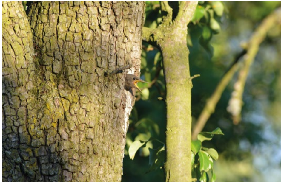
Mám hlad, mami!, autor Václav Ulčák