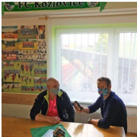
Rozhovor, autor Lukáš Němec

Zhruba v půlce května došlo k uvolnění některých opatření, které dovolily začít se sportováním ve venkovním prostředí. Klub toho využil a začal s tréninkovými jednotkami. Můžeš nastínit aktuální stav? Jaká je účast na trénincích? A také jakým způsobem restrikce ovlivňují tréninky?