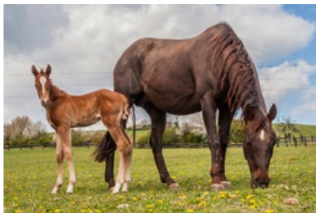
Podhůří Beskyd poskytuje jedinečné výhledy a pastviny

Ranč se pyšní také dlouholetou tradicí letních příměstských táborů. Děti se během několika dní důkladně seznámí s chovem koní, s jejich povahou, s jízdou, a především na vlastní kůži zjistí, co všechno obnáší péče o tato krásná zvířata. Ráno uklidit stáje, nastlat, nakrmit a vyhřebelcovat koně, osedlat je, zajezdit si, koně umýt, večer opéct špekáčky při zapadajícím slunci. Pro mnohé ratolesti vysněné prožití prázdnin!