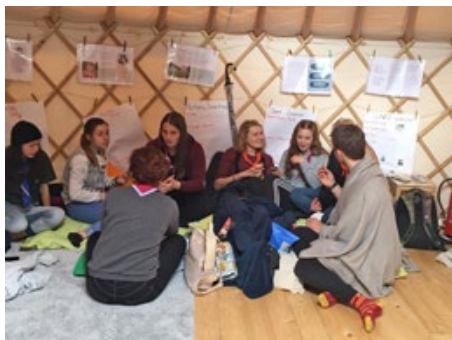
Debata nad táborovým programem