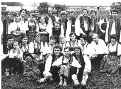
1979 - Druhá Valašská slavnost v Kozlovicích, archiv souboru