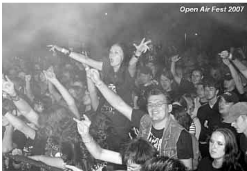
Open Air Fest 2007