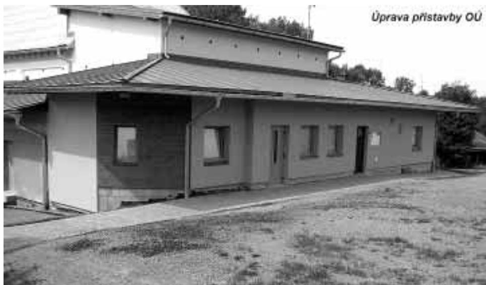
Úprava prístavby OÚ