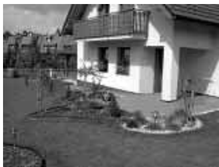
Realizace zahrad na klíč